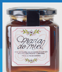
Tarro de Miel "Maria de Miel"